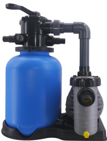
Beispielfoto. Kann variieren!

Bali/ Bali Premium/ ECO Sandfilteranlage mit 6-Wege-Top-Mount-Ventil